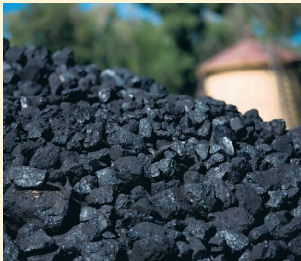
Czyt. str. 4