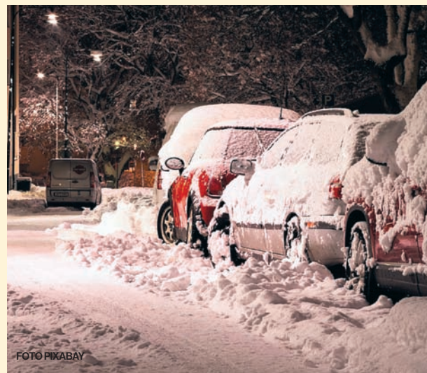
Czyt. str. 8