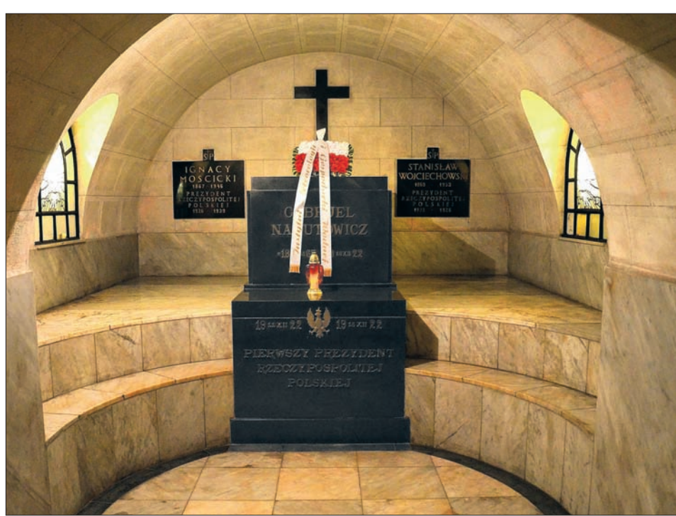
Grób Gabriela Narutowicza, Bazylika archikatedralna św. Jana Chrzciciela w Warszawie.