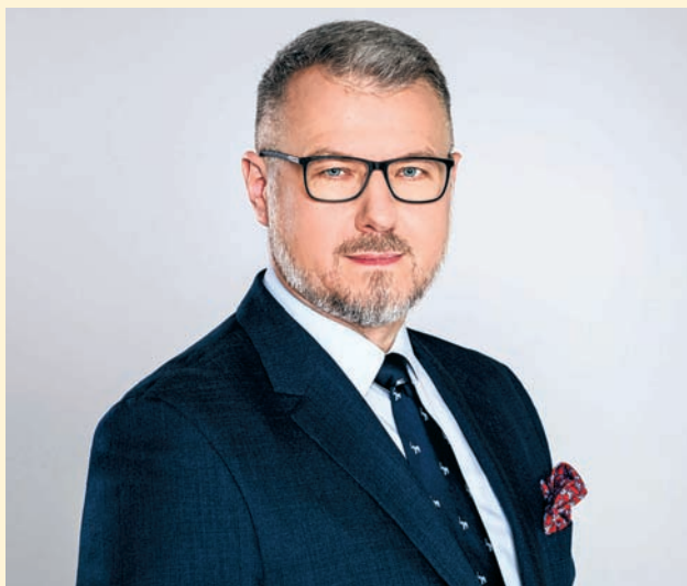
Czyt. str. 10