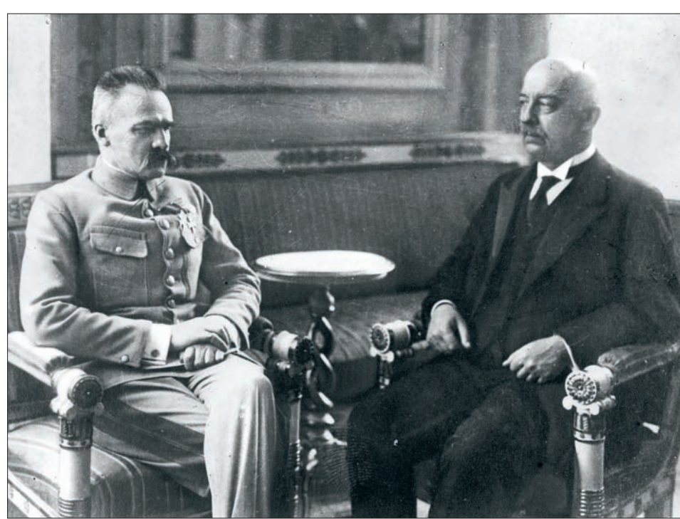
Gabriel Narutowicz z Józefem Piłsudskim.