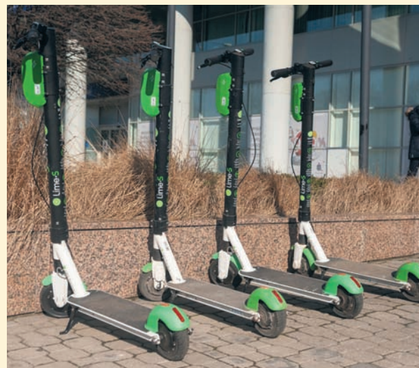
Czyt. str. 13