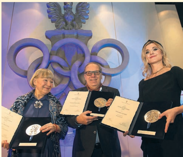
Czyt. str. 6