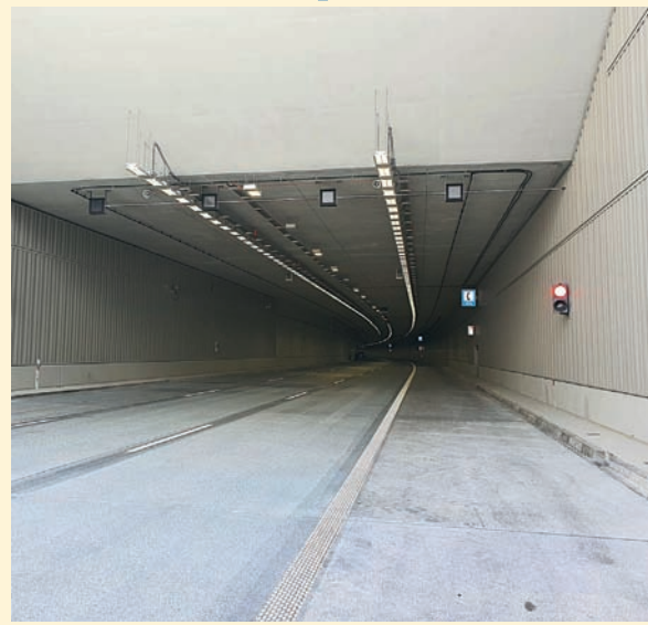
Czyt. str. 6