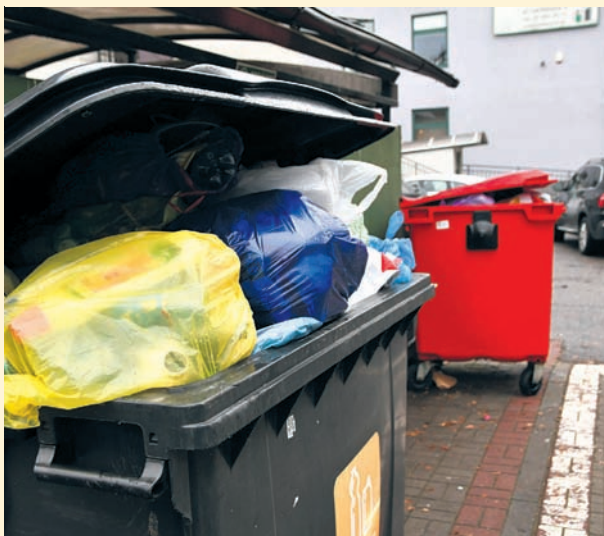
Czyt. str. 11