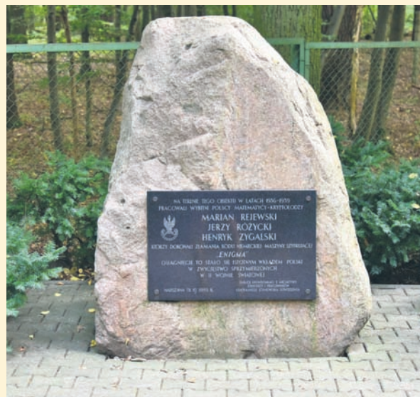
Czyt. str. 10