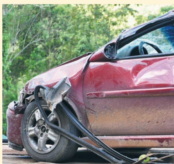
Czyt. str. 13