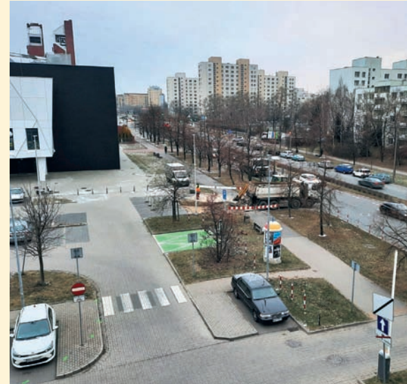
Czyt. str. 4