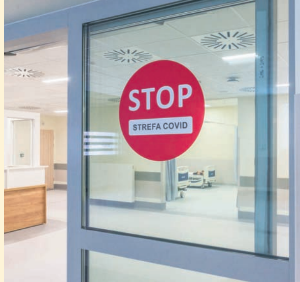
Czyt. str. 6