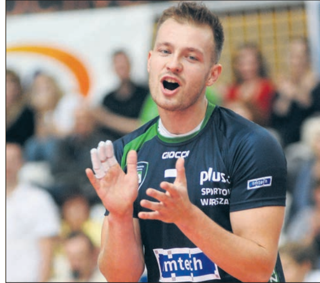
Czyt. str. 7