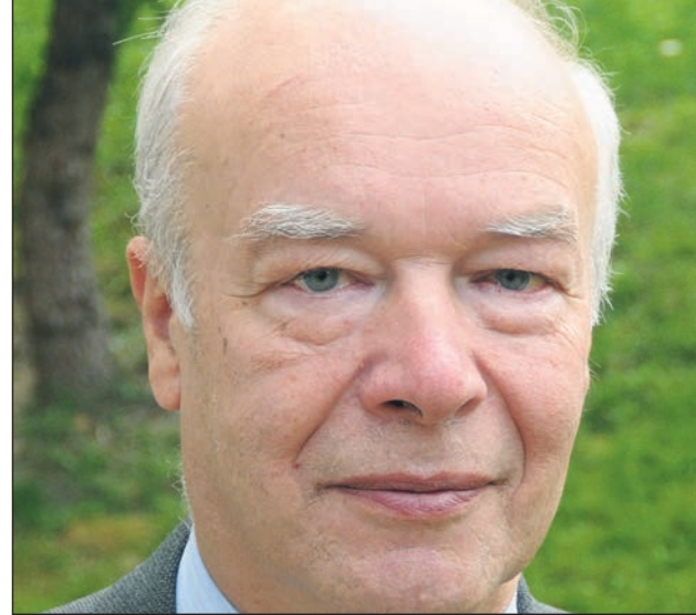
Czyt. str. 9