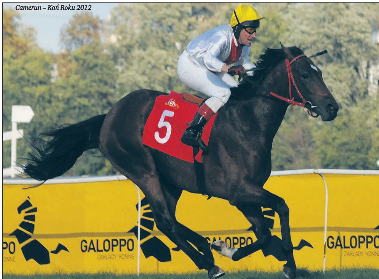
Camerun – Koń Roku 2012

wego. Ma on być zachowany, ale planuje się jego wykorzystanie również w celach rekreacyjnych. Mówi się także o urządzeniu nowego toru roboczego na wewnętrznej bieżni i przeniesieniu gonitw płotowych na bieżnię zewnętrzną, na której rozgrywane są gonitwy płaskie. Technicznie istnieje taka możliwość, ponieważ przesuwanie