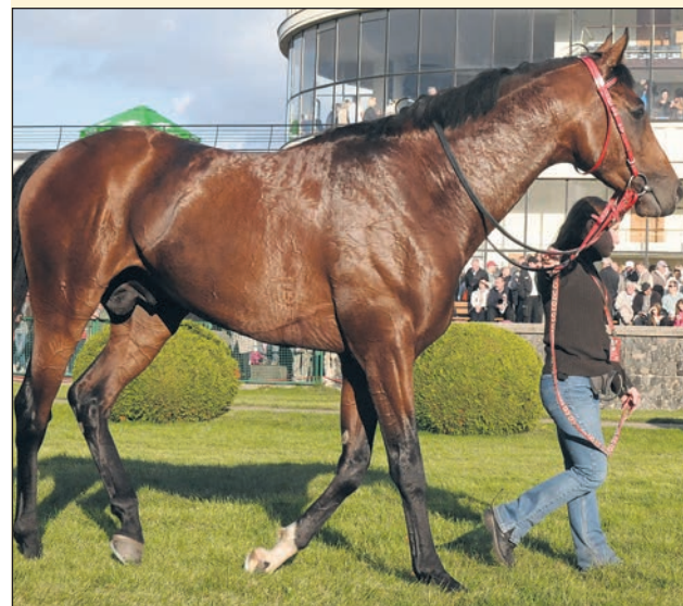
Czyt. str. 13