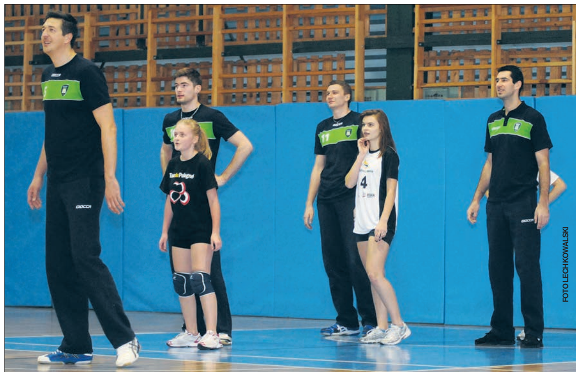
Trening siatkarzy Politechniki w Gimnazjum nr 92 im. Juliana Ursyna Niemcewicza