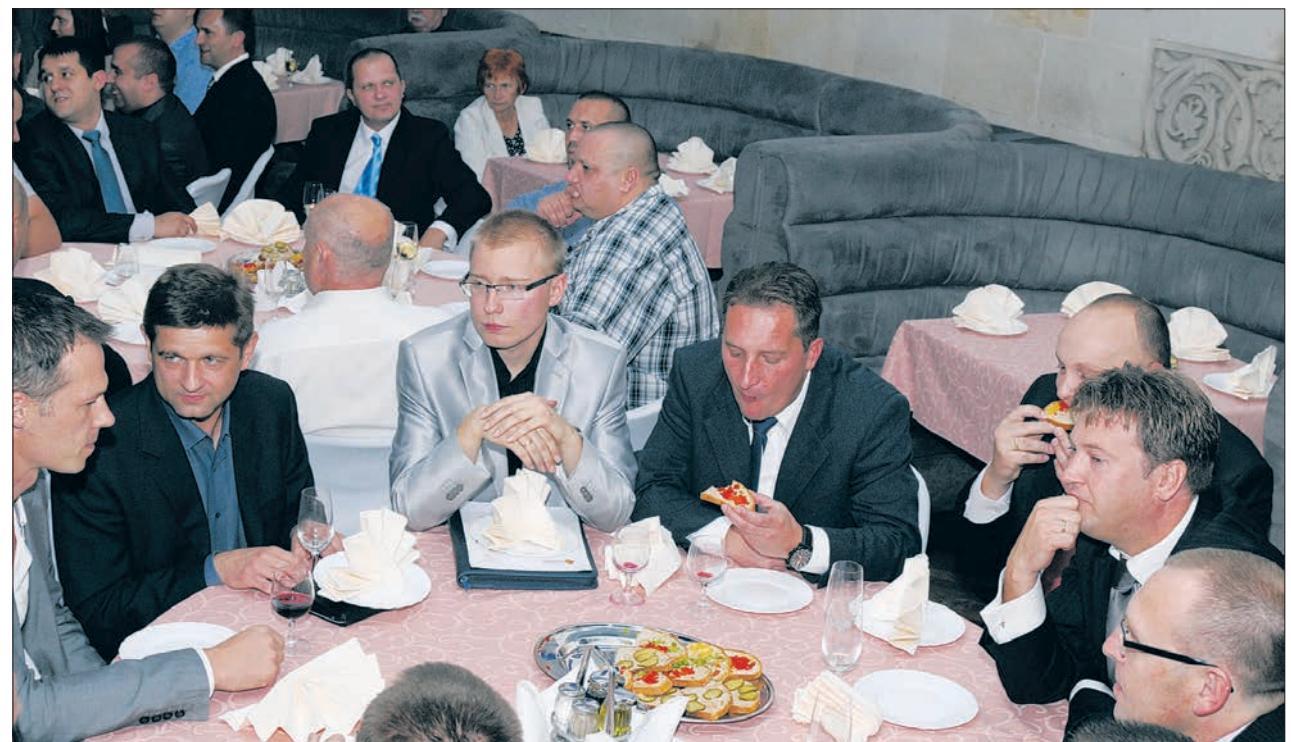
Zadowolone miny kadry inżynierskiej