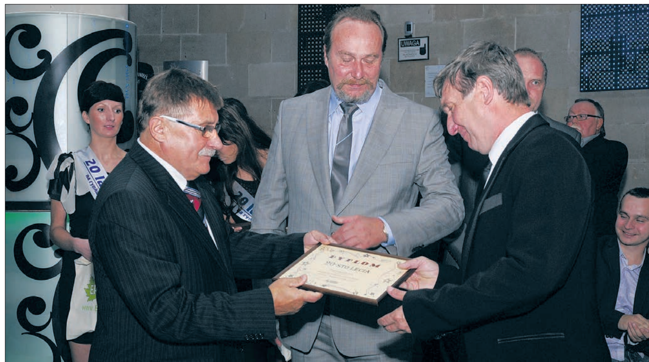
Wręczenie dyplomów przez Zarząd Spółki