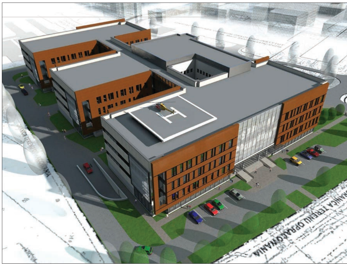
Wizualizacje Szpitala Południowego przedstawione na stronach Stołecznego Zarządu Rozbudowy Miasta