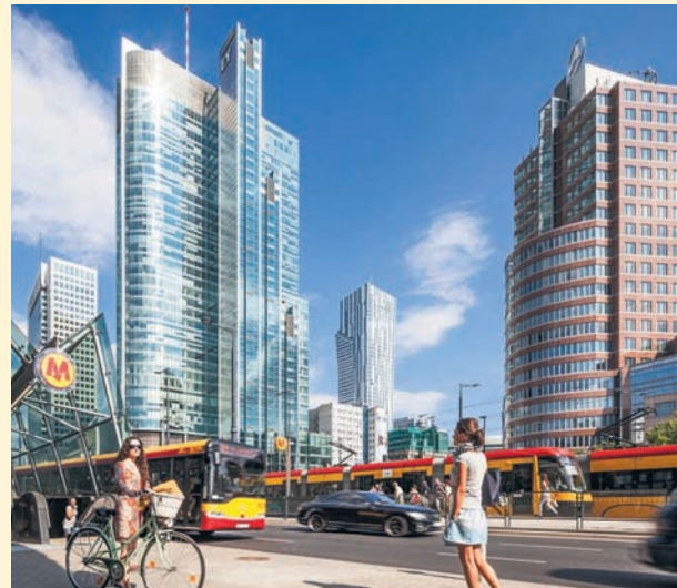
Czyt. str. 8