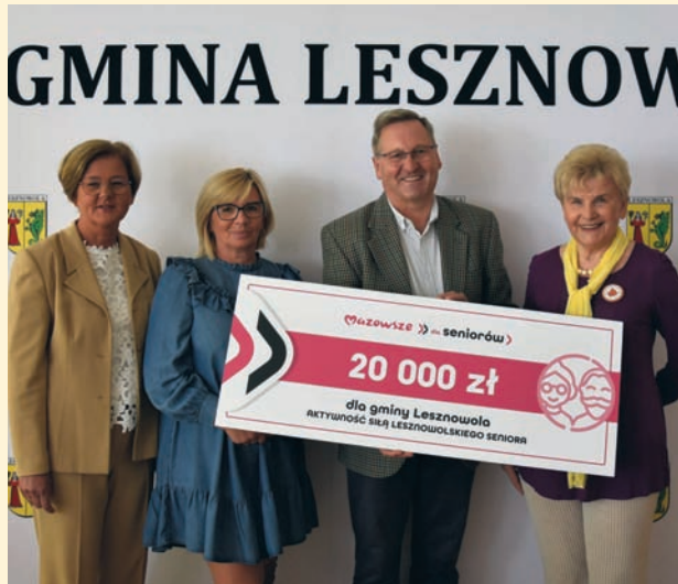
Czyt. str. 6