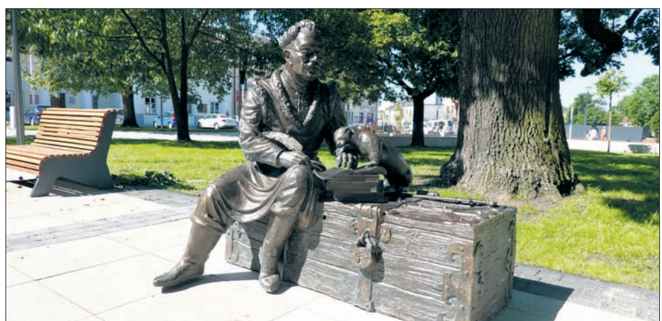
Jan Chryzostom Pasek i jego wydra.