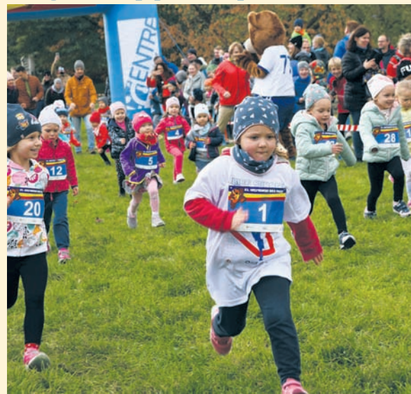
Czyt. str. 5