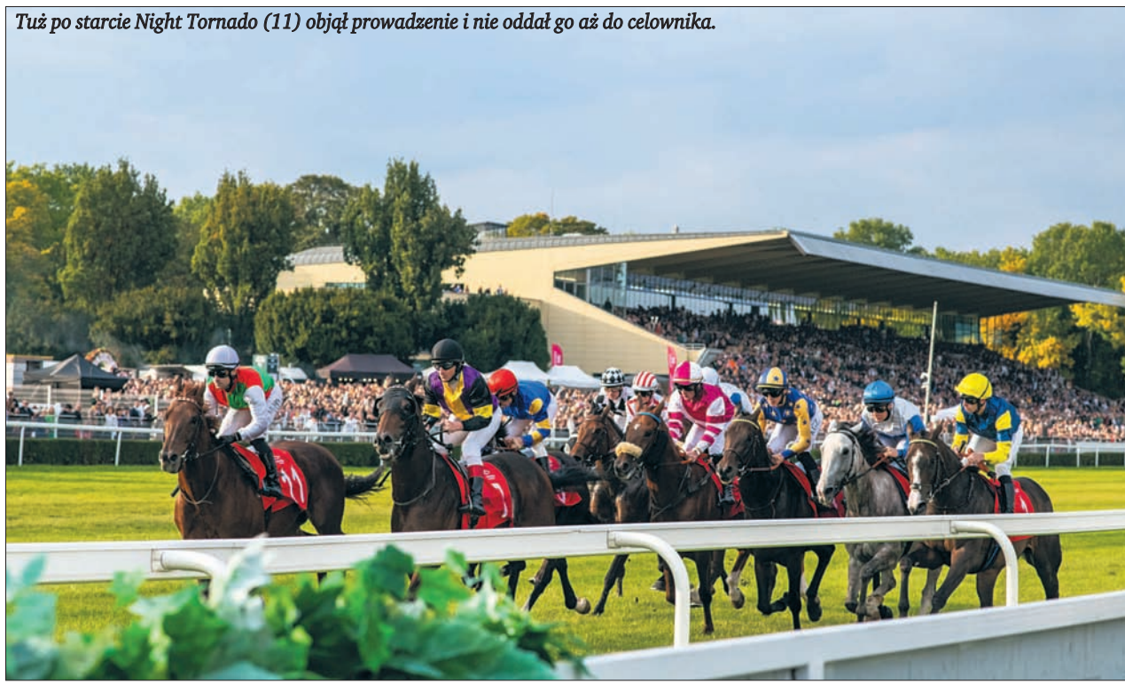
Tuż po starcie Night Tornado (11) objął prowadzenie i nie oddał go aż do celownika.

Opracował Tadeusz Porębski