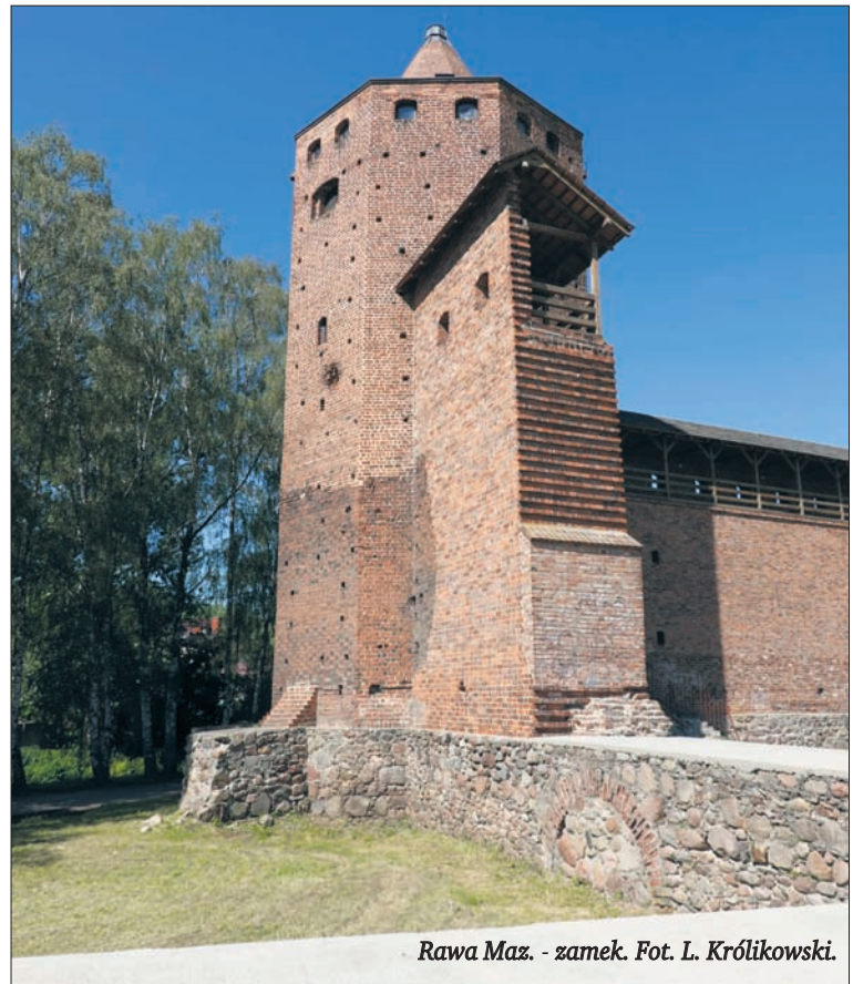
Raw Maz. - zamek.

Prawa miejskie Rawa uzyskała przed 1321 r. i w chwili założenia należała do