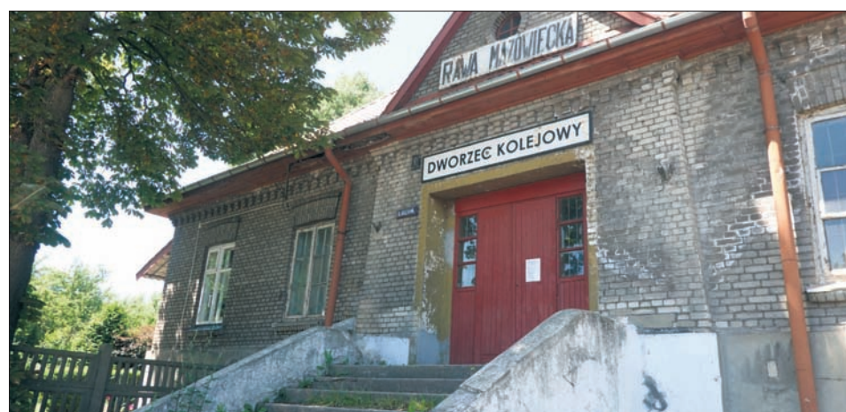
Raw Maz., dworzec kolejowy.