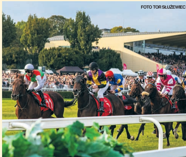
Czyt. str. 10