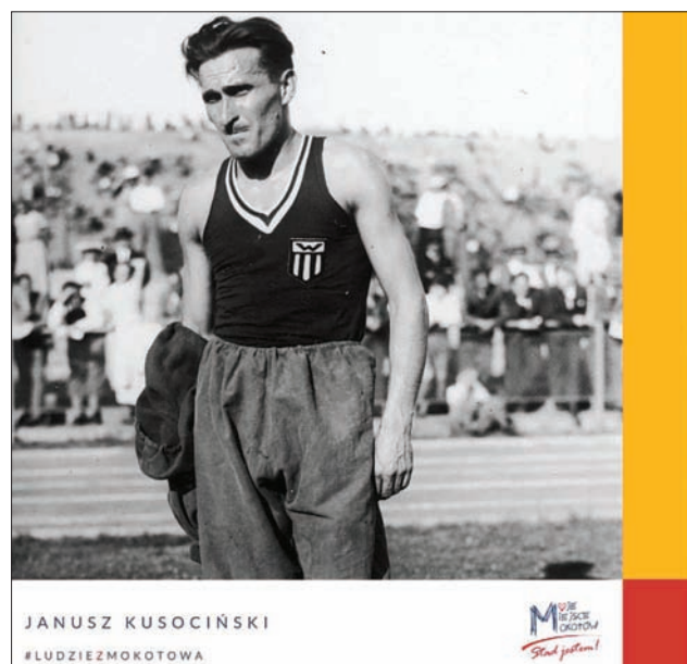
JANUSZ KUSOCIŃSKI #LUDZIEZMOKOTOWA

Program Dni Otwartych MAL oraz mapa warszawskich MAL-i znajdują się na stronie internetowej sąsiedzkiej Warszawy. Przykładowo w kalendarzu wydarzeń na najbliższy weekend można znaleźć śniadanie sąsiedzkie w MAL Grójecka 109 oraz Dzień Ziemiaka – sąsiedzki piknik w ogrodzie w MAL Samogłoska, a kolejny tydzień rozpocznie Gimnastyka dla Seniorów i Seniorów w Miejscu Akcji Piaskowa 7.