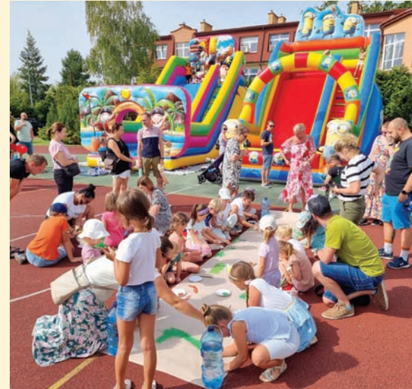
Czyt. str. 9