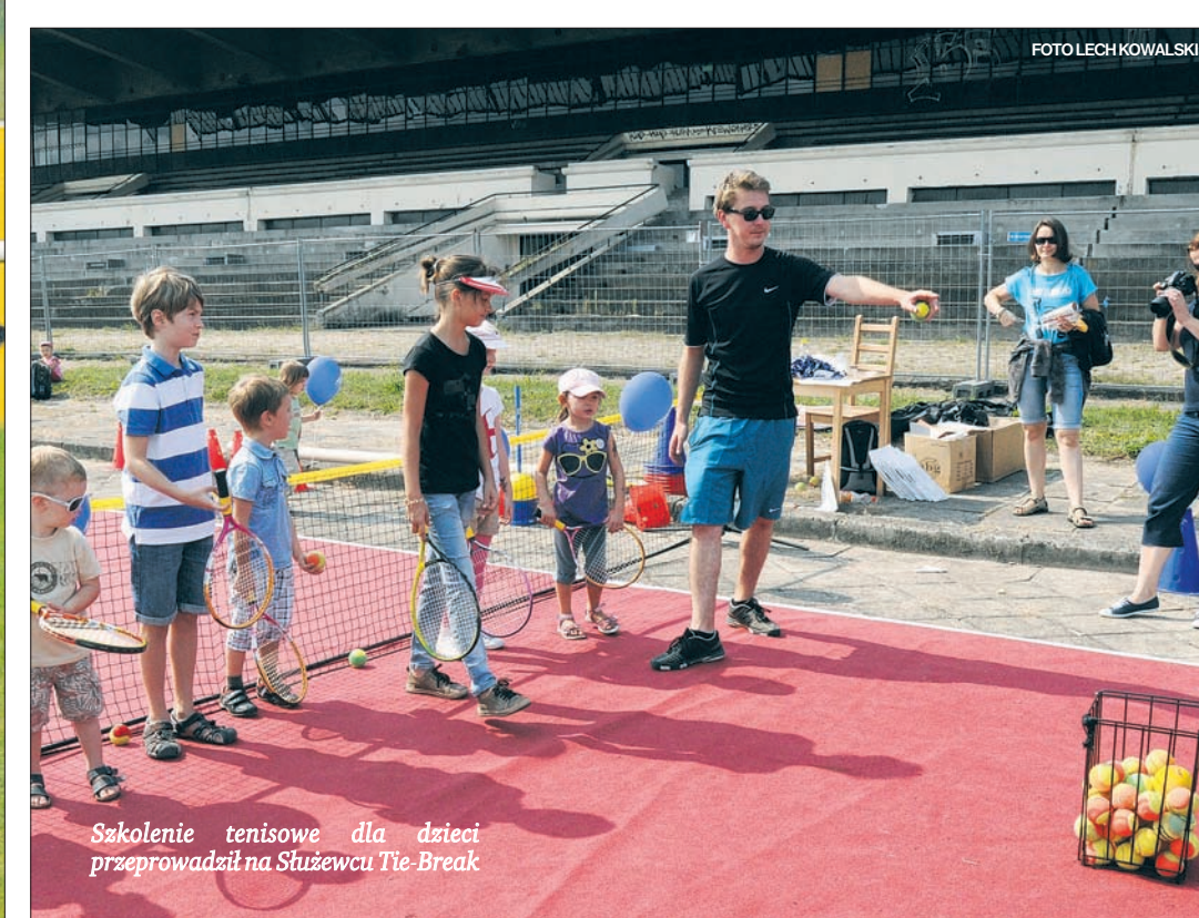
Szkolenie tenisowe dla dzieci przeprowadził na Służewcu Tie-Break