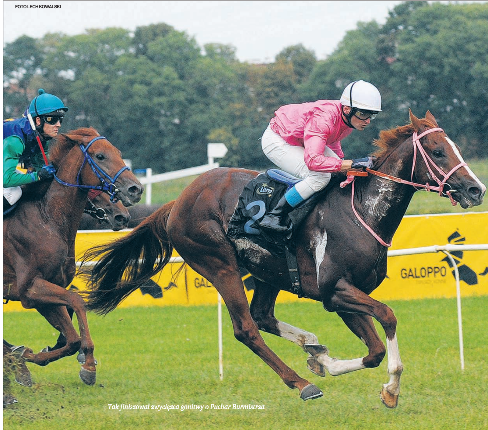
Tak finiszował zwycięzca gonitwy o Puchar Burmistrza

W niedzielnym pikniku zorganizowanym przez urząd dzielnicy Ursynów na stulecie hipodromie wzięło udział kilkanaście tysięcy ursynowian. Tę masową imprezę, wpisana do kalendarza obchodów związanych z Ursynowskim Pożegnaniem Lata, należy uznać za pożyteczną i bardzo udaną pod względem organizacyjnym.