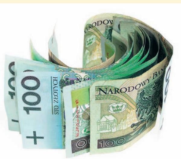
Czyt. str. 4