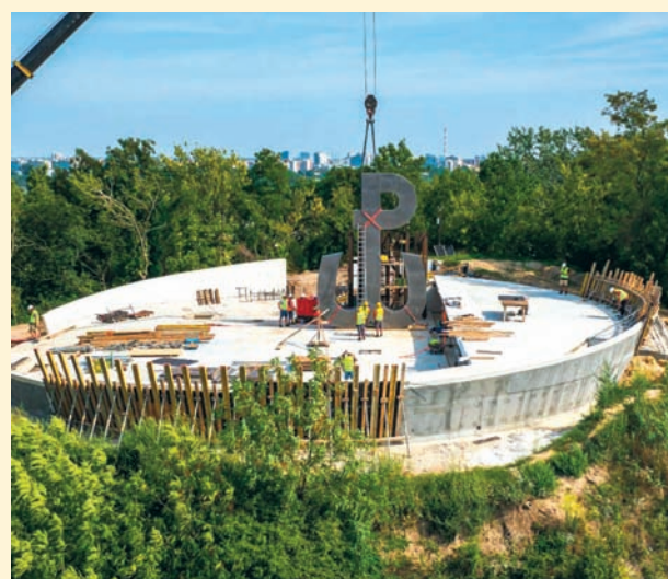
Czyt. str. 6