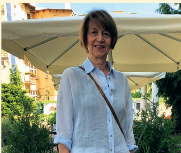
Czyt. str. 8 i 9