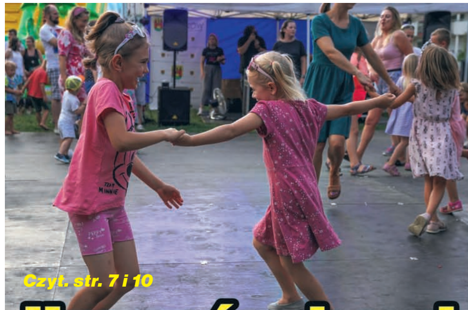
Czyt. str. 7 i 10