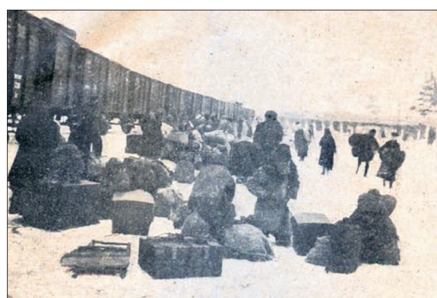
Repatriacja Polaków z Rosji zimą 1921 na 1922.